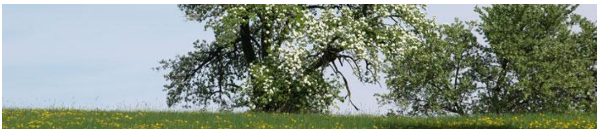
Blumenlandschaft bei Bewangen